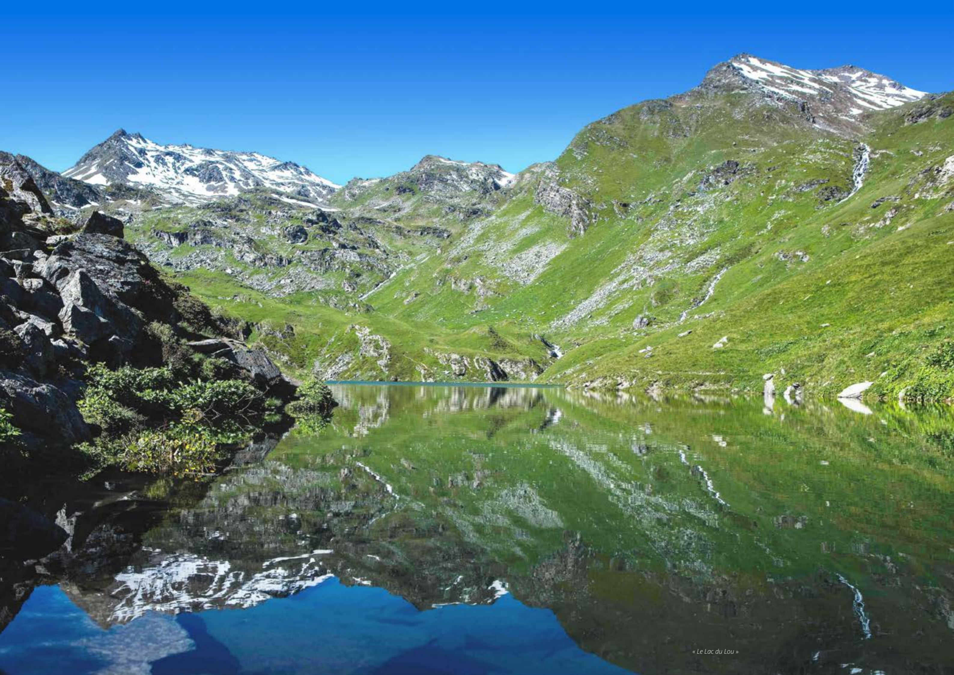
« Le Lac du Lou »