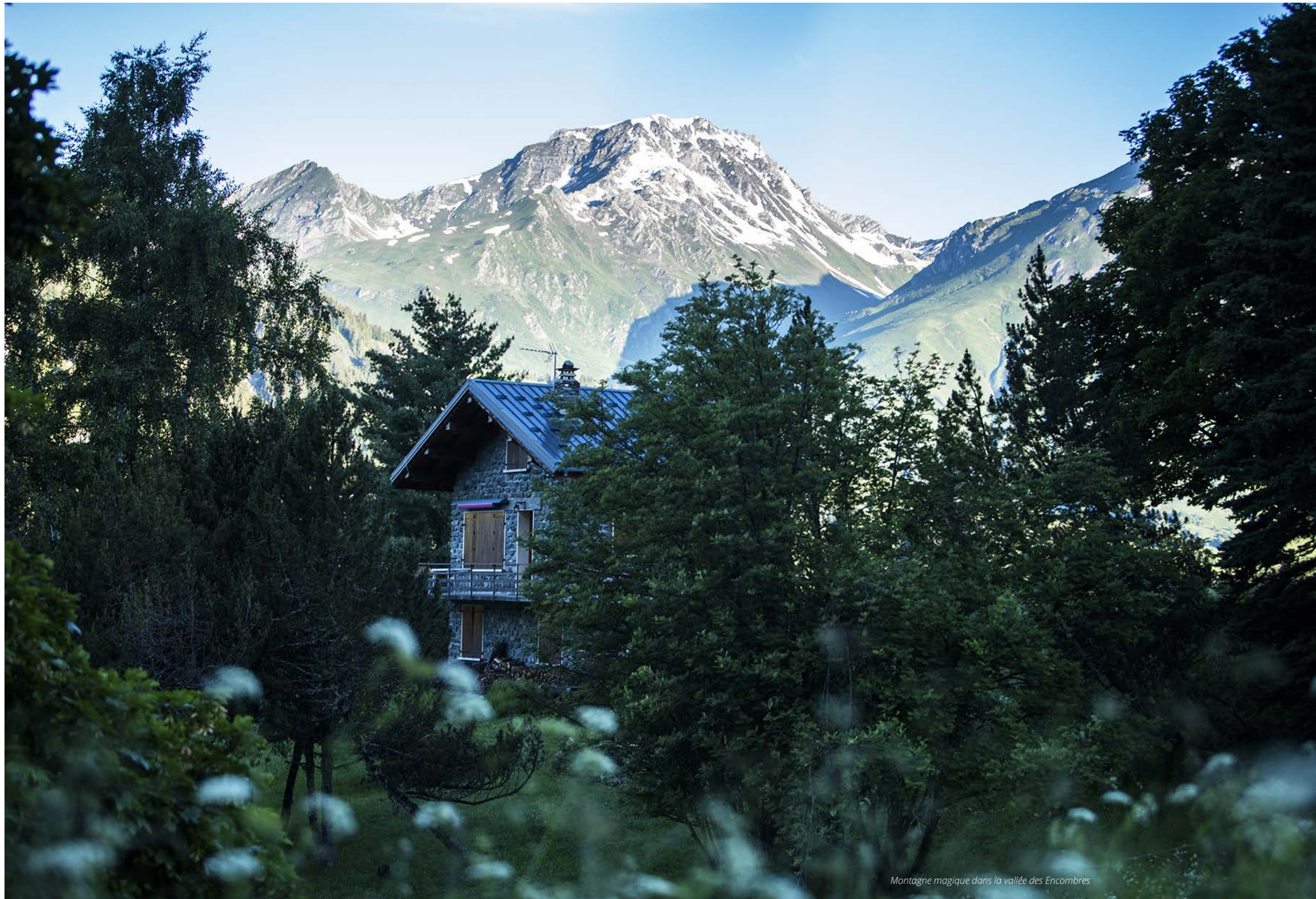
Montagne magique dans la vallée des Encombres