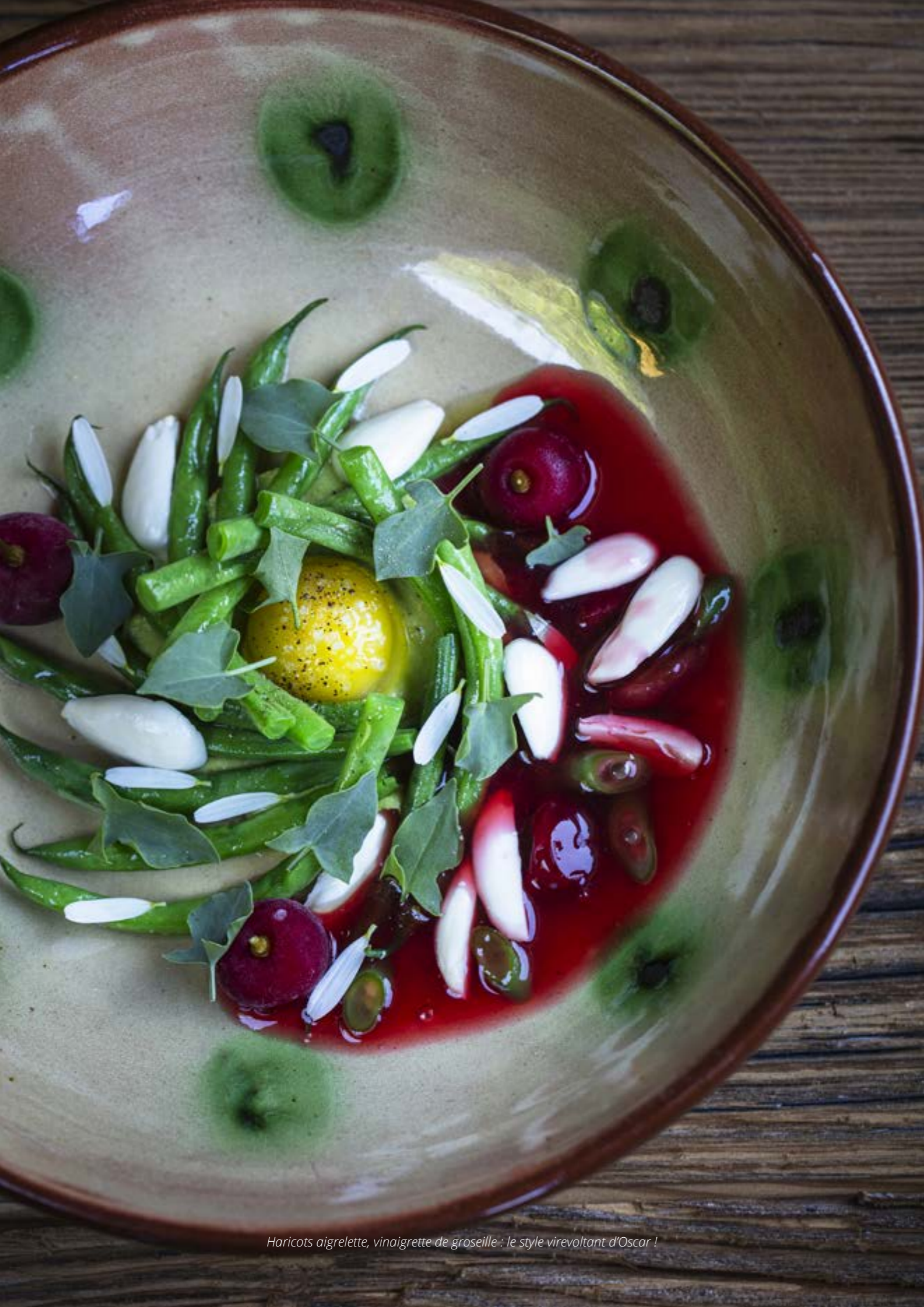
Haricots aigrette, vinaigrette de groseille : le style virevoltant d'Oscar !