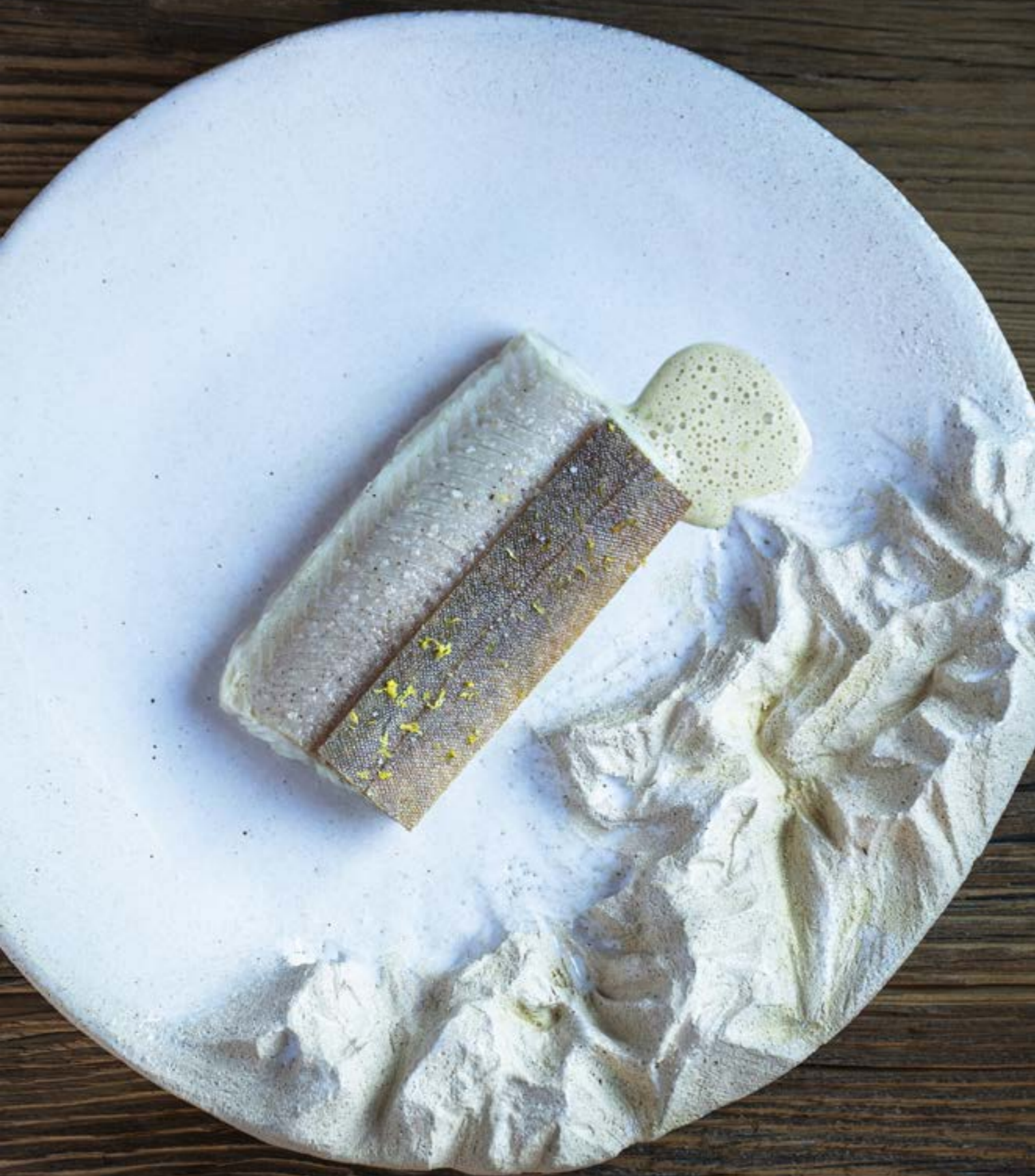
Prince des lacs... Ombre chevalier, chair tremblante, peau craquante, sauce vierge.