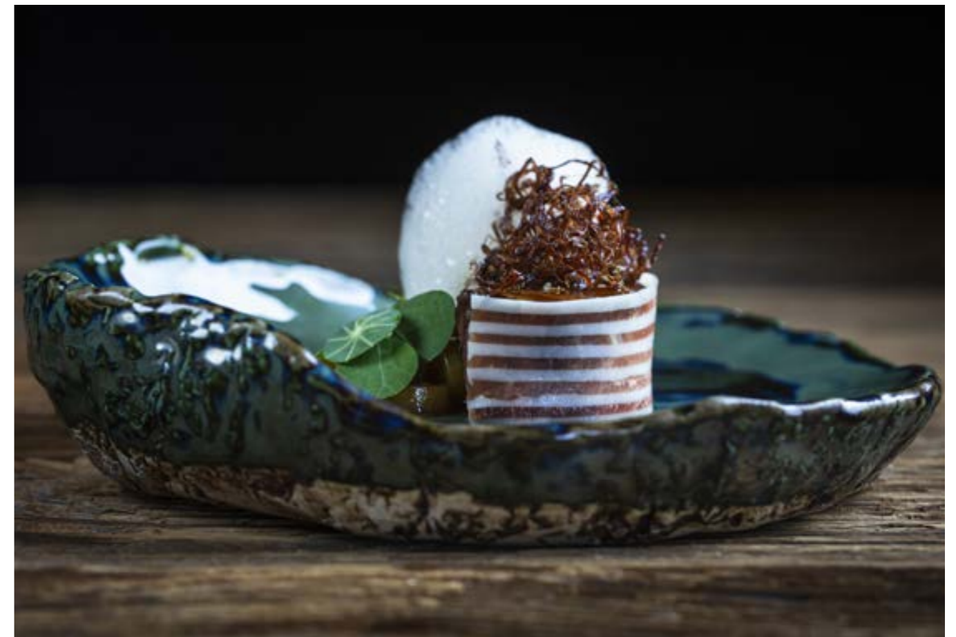
Légume mal aimé et pourtant si bon... Croznes en marinade, vinaigrette condimentée