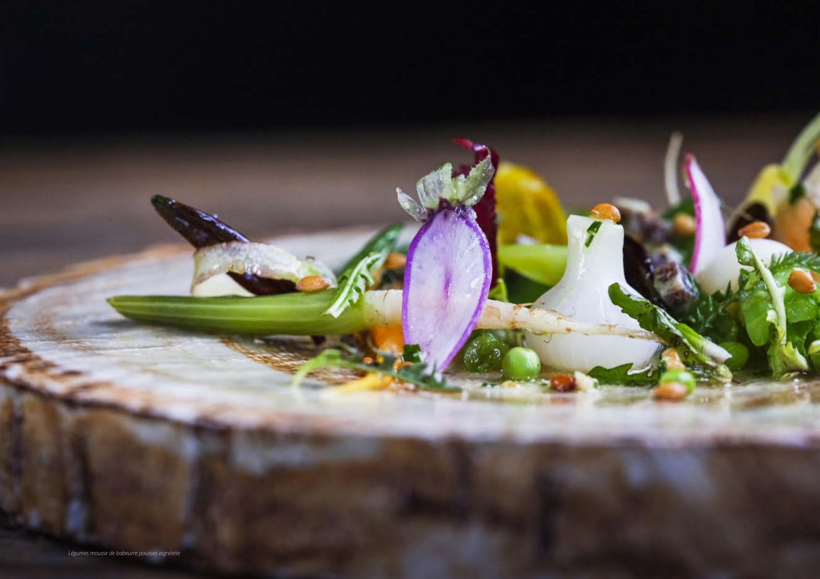
Légumes mousse de babeurre pousses aigrette