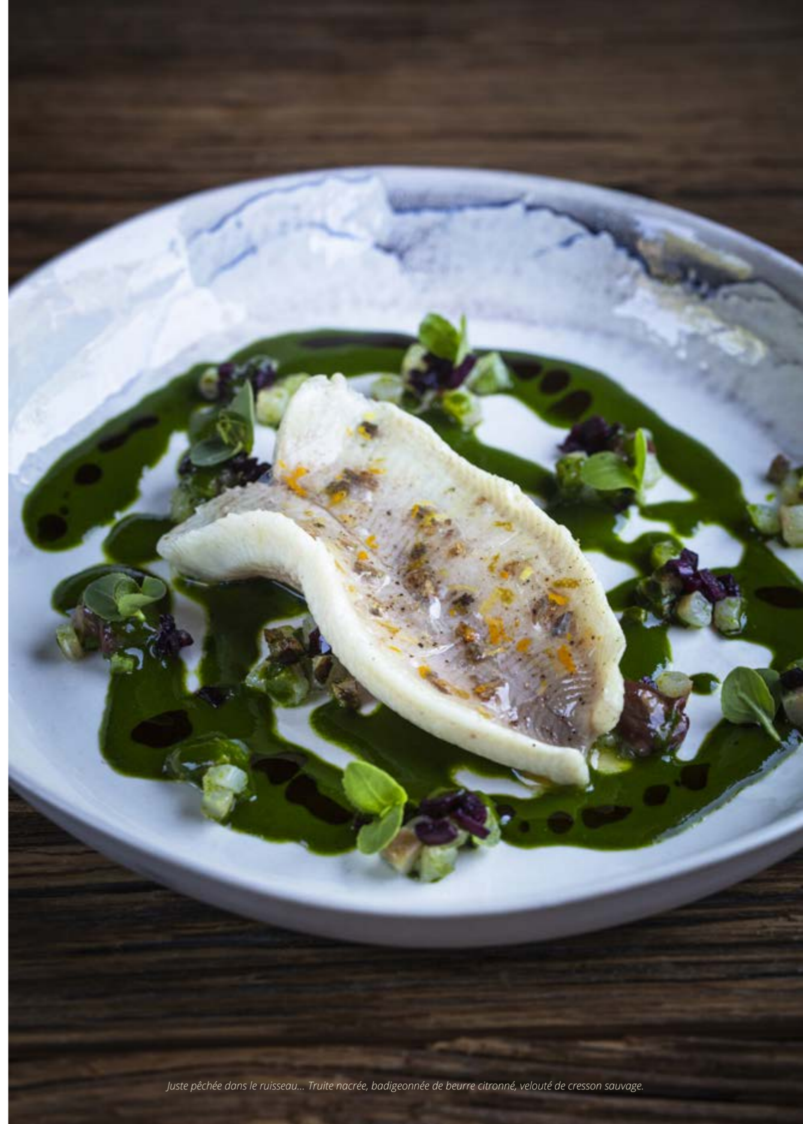
Juste pêchée dans le ruisseau... Truite nacrée, badigeonnée de beurre citronné, velouté de cresson sauvage.